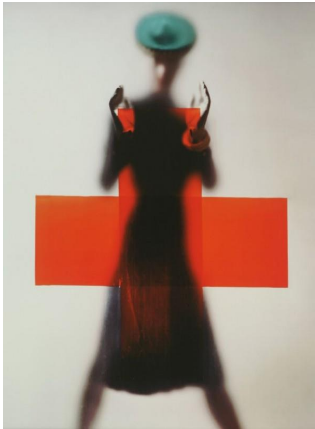
E. Blumenfeld, Red cross, New York, 1945

A modo de conclusión podemos señalar que Blumenfeld realiza un tipo de composiciones novedosas en los que muestra la ropa, pero sin reproducirla tal cual, dando más importancia a la búsqueda de lo insólito, al igual que los surrealistas. Tomando el elemento sorpresa de sus experimentos de la etapa dadaísta. Así mismo, el azar interviene en sus imágenes, tanto en la toma, como en la manipulación en el laboratorio, algo que no abandonará nunca. Su estilo, alejado de los convencionalismos de la fotografía, se caracteriza por osados efectos ópticos y por un preciso control de la luz y de las técnicas de laboratorio.