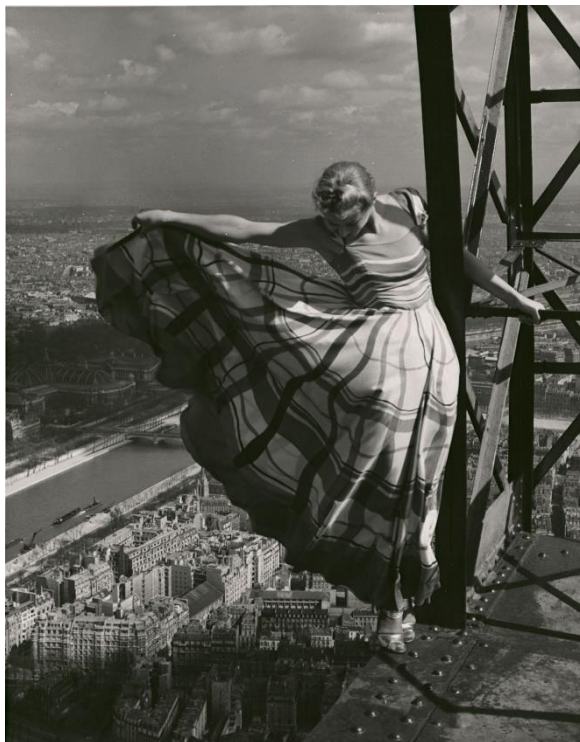
Erwin Blumenfeld. Vogue , Mayo 1939

Debido a su fidelidad documental, la fotografía se presentaba como el instrumento ideal para plasmar los objetos inconexos, convirtiéndose en testimonio de la existencia de ese encuentro casual, consiguiendo desligarse de la realidad debido a la incongruencia y la falta de sentido del contenido (Tausk, 1978:70).