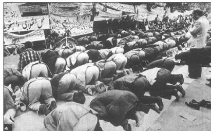
La Vanguardia , 22/11/1979. p. 1