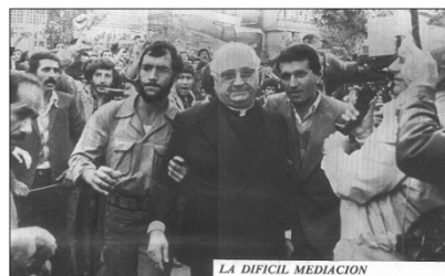
La Vanguardia , 15/11/1979. p. 1