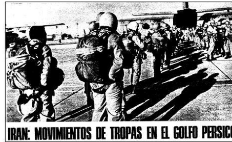
ABC, 28/11/1979, portada.