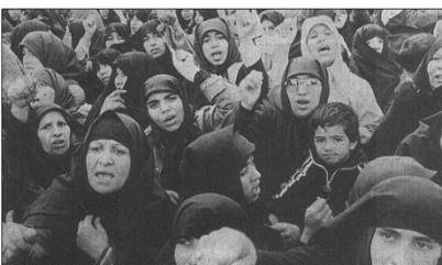
La Vanguardia , 22/11/1979. p. 1