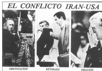
La Vanguardia , 17/11/1979. p. 1