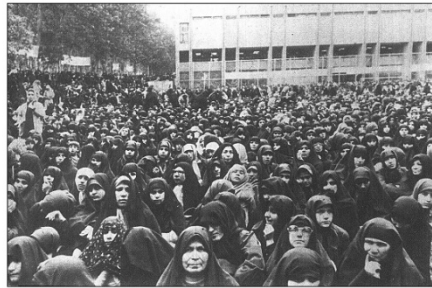
La Vanguardia , 09/11/1979. p. 1