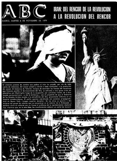
ABC, 06/11/1979, portada.