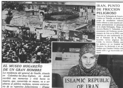
La Vanguardia , 08/11/1979. p. 1