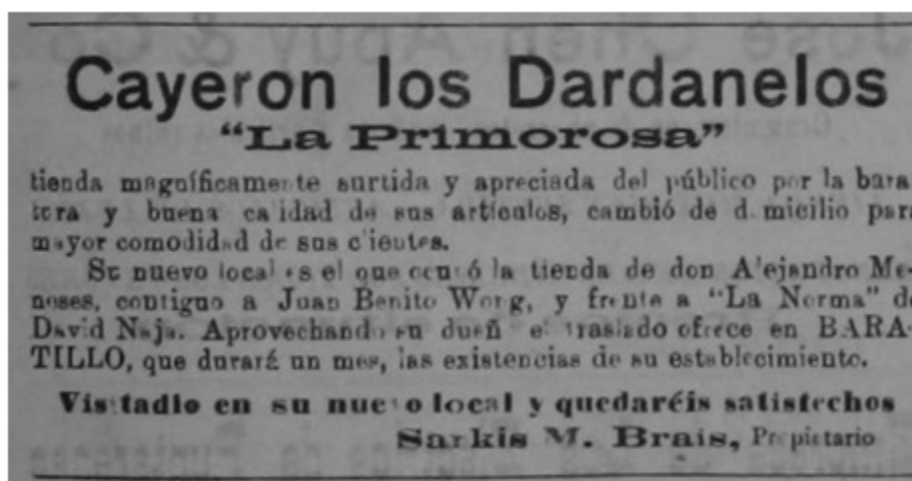
Figura 8. El Correo de la Costa , 01-01-1916: 3