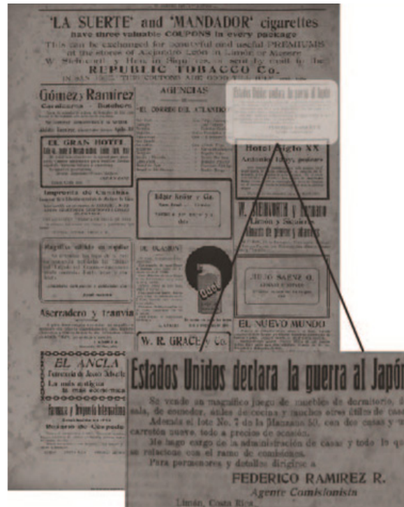
Figura 7. El Correo del Atlántico , 18-01-1915: 4