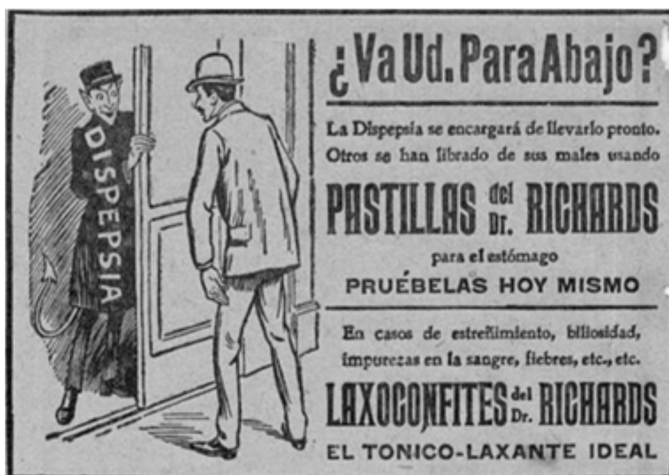
Figura 5. El Correo del Atlántico , 10-01-1917: 4

El mensaje que emite este anuncio es claro: si el consumidor no adquiere el fármaco su salud decaerá (se irá para abajo), si se pierde la salud se corre el riesgo de morir e ir al infierno (abajo), la solución para librarse de estos males está entonces en comprar las Pastillas del Dr. Richards.