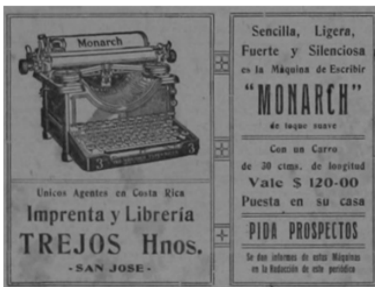
Figura 2. El Correo del Atlántico , 25-01-1915: 2

En el caso del aviso de la academia de detectives, es claro que obtener un título en el extranjero y estudiar una profesión poco usual en Costa Rica no son las únicas ventajas. Para la fecha en la que se publica el anuncio, el desempleo azota el país y, además, en una nación sin universidades y con que apenas había abierto su primera escuela normal en 1914, este tipo de ofertas daban la posibilidad de insertarse en un mercado laboral poco diversificado.