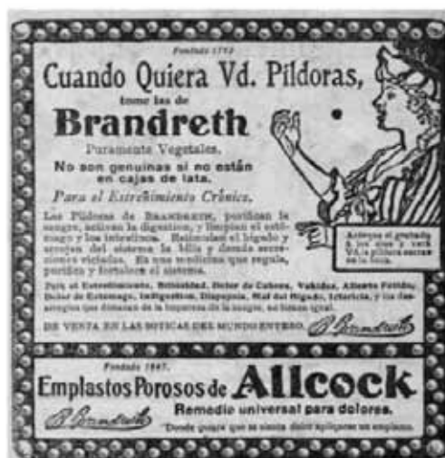
Figura 1. El Correo del Atlántico , 20-01-1917: 3

purifican la sangre, activan la digestión y limpian el estómago y los intestinos. Estimulan el hígado y arrojan del sistema la bilis y demás secreciones viciadas. Es una medicina que regula, purifica y fortalece el sistema ( El Correo del Atlántico , 20-01-1917, p. 3).