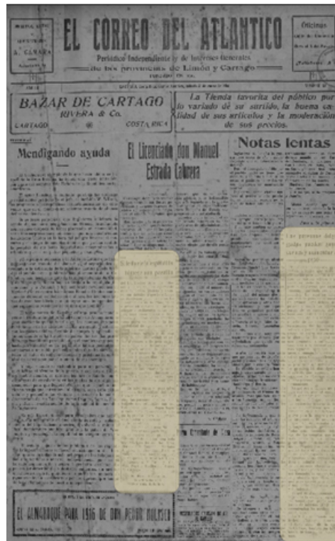
Figura 6. El Correo del Atlántico , 08-01-1916: 1

Una estrategia recurrente entre los anunciantes fue la de presentar la publicidad con un formato similar al de las noticias: con titulares en negrita e historias que hacían creer al receptor que leía un hecho insólito y noticioso, pues la información del producto se guardaba para el final del mensaje. Noticias y publicidad se confundían entre las columnas de los periódicos como lo muestra la Figura 6, donde aparecen destacados dos anuncios publicitarios.