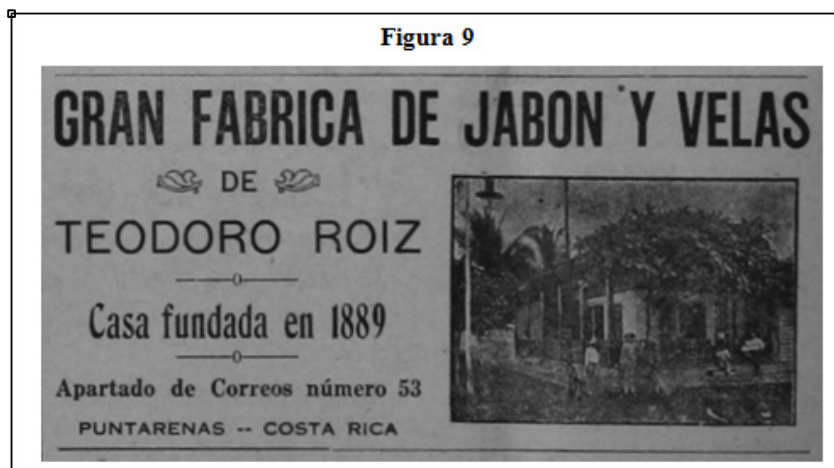
Figura 9. El Correo de la Costa , 08-01-1915: 2