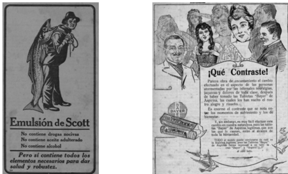
Figura 4. El Pacífico , 15-01-1916: 4 y Correo del Atlántico , 20-01-1917: 2