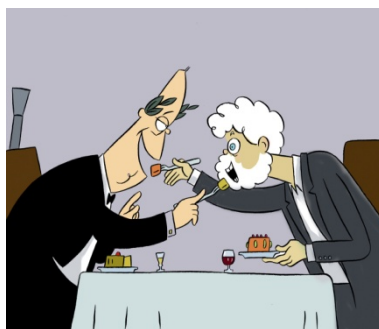
Figura 2: Siro, caricatura de Manuel Fraga y Xosé Manuel Beiras, La Voz de Galicia , 2002.

Siro (Siro López Lorenzo, Ferrol, 1943) es, probablemente, el humorista que más se ha empeñado en vincular al humor gráfico gallego con la tradición iniciada con Castelao, al que ha estudiado pormenorizadamente y con el que fue comparado en sus inicios. Tras trabajar durante 30 años como caricaturista político en La Voz de Galicia , se retiró del oficio en 2006 para centrarse en la pintura y el ensayo. En la radio, entre otras iniciativas, dirigió el programa Corre Carmela que chove , que alcanzó una gran popularidad.