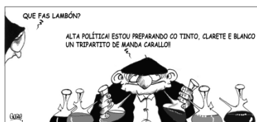
Figura 6: Gogue, Floreano, Faro de Vigo .

Pepe Carreiro (Xosé Carreiro Montero, Vigo, 1954) es, con Xaquín Marín, el único humorista gráfico gallego de los actualmente en ejercicio que dibuja en gallego, según Siro (entrevista personal, 17-2-2012), aunque él discrepa de esta apreciación. Además es uno de los más críticos, como mostró en La Voz de Galicia , El Mundo (Galicia) o Xornal de Galicia , y de lo que da fe su libro recopilatorio Fraga na Galiza (Laivento, 1997). Una crítica que acabó por cerrarle las puertas de los diarios.