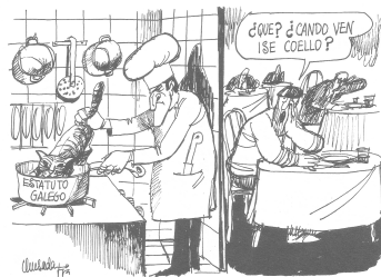
Figura 1: Quesada, Adolfo Suárez, Faro de Vigo , 1979

Todos estos humoristas son buena prueba de que el humor gráfico puede y debe ser considerado un género periodístico de opinión, como señalan cada vez más autores (Morán, 1988; Gomis, 1987 y 2008; Santamaría, 1997; Galindo, 2000; Barrero, 2007; Tejeiro y León, 2009; Paniagua, 2011). Todos ellos subrayan su semejanza con la columna e incluso con el editorial, a pesar de tener sus peculiaridades (Barrero, 2007: 31-32; Gomis, 1987: 244-246). Por eso, Paniagua (201: 162), en feliz juego de palabras, dice que la del humor gráfico no es solo una “opinión dibujada”, sino también “desdibujada”. La Constitución de 1978 consagró el derecho a la información y la libertad de prensa, y permitió así el libre ejercicio de la crítica periodística, también desde el humor gráfico. Esto impulsó, sin duda, el acercamiento del dibujo de humor al periodismo de opinión. En Galicia, el caso más acentuado quizás sea el de Siro, quien durante más de 20 años se encargó a diario de comentar gráficamente la noticia más importante de la política gallega. La viñeta acompañaba a la información en las páginas de “Galicia”, en una práctica quizás única en toda España por su duración y sistematicidad.