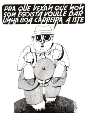
Figura 3: Xaquín Marín, El Ideal Gallego , 1976.

Xaquín Marín Formoso (Ferrol, 1943) está considerado el padre del cómic gallego junto al desaparecido Reimundo Patiño, con el que en 1975 publicó el libro Dúas viaxes . Como humorista colaboró en Hermano Lobo y La Codorniz antes de incorporarse a la prensa diaria gallega, primero en El Ideal Gallego (1975) y luego, desde 1988 hasta la actualidad, en La Voz de Galicia . Fue fundador y director del Museo do Humor de Fene (1984). Es el padre de personajes como Gaspariño o Isolino. No es solo uno de los mejores y más internacionales humoristas gráficos gallegos de los últimos cuarenta años, sino también y sobre todo, según el propio Siro, “o grande innovador do humor gráfico galego desde Castelao, aínda que a súa aportación resulte tan persoal que non posibilite a aparición de continuadores” (López, 1997: 18). El mérito de Marín consiste en haber transformado “a caricatura modernista alemana, galeguizada por Castelao, dotándoa dunha forza e solidez que fan recordar o mellor das nosas artes románica e barroca” (López, 1997: 18).