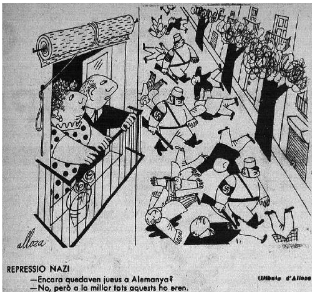
L'Esquella de la Torratxa , núm. 3091, 25/XI/1938, p. 7.

l'antisemitisme del franquisme i l'utilitza argumentativament amb el propòsit de criminalitzar aquesta actitud. Com hem comprovat anteriorment a l'Abc coetani, el sentiment antijeu de part del nacionalisme espanyol de la Guerra d'Espanya, hi era present. Ho deien els seus partidaris i ho deien també els seus enemics ideològics. Els primers, es defensaven amb arguments antisemites. Els segons, atacaven els primers per aquests mateixos sentiments, que van derivar en la coneguda persecució contra els jueus a l'Alemanya nazi. Persecució que des d'Espanya va ser justificada i recolzada pel nacionalisme espanyol franquista. Una altra burla de L'Esquella de la Torratxa cap a l'Alemanya hitleriana és aquesta que afegim.