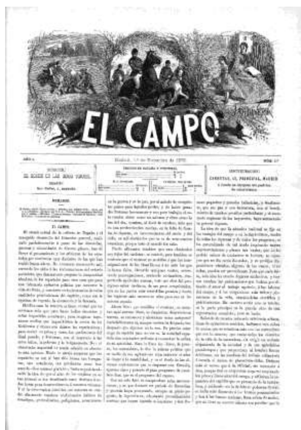
Registro y primera cabecera de El Campo: agricultura, jardinería y sport (01/12/1876).