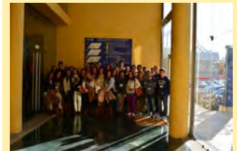
IES José Cadalso

Más de 150 alumnos han podido visitar las instalaciones del CNA durante la Semana de la Ciencia.